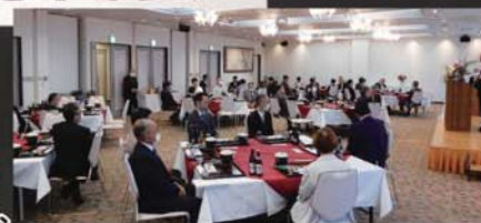
総代会終了後は、 割烹 八文字屋へ移動し懇親会。