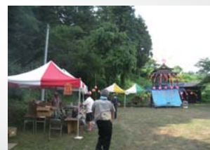
盆踊り会場の準備風景