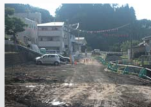
ぬる湯さん前から雁木田橋方向

先日、国道288号バイパスの一部供用開始があり、桜川の河川改修も着々と進み、さらには雁木田橋を含む踊り場周辺の改修工事も始まろうとしており、様変わりしつつある我が八幡町支部商店街です。ぜひ、散歩がてらお越しください。