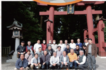
彌彦(弥彦)神社参拝