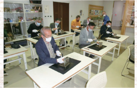
燕市産業資料館では純銅タンブラー鋳目入れを体験しました。