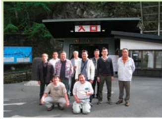
[日時] 平成22年5月8日(土)～9日(日) [参加人数] 11名 [行先] 岩手方面

今回の旅行は、2日間大変良い天気でした。1日目は盛岡で冷麺を食べ、龍泉洞を見学しました。エメラルドグリーンの地底湖はすばらしいものでした。2日目は宮古魚市場で鮮魚などのお土産を買い三陸海岸の浄土ヶ浜を見て釜石大観音を見学し、昼食はウニやイクラやホタテなどの海鮮丼を頂きました。三春到着後はぬる湯旅館で、2日間の旅行の話で大いに盛り上がりました。また行きたいと思います。