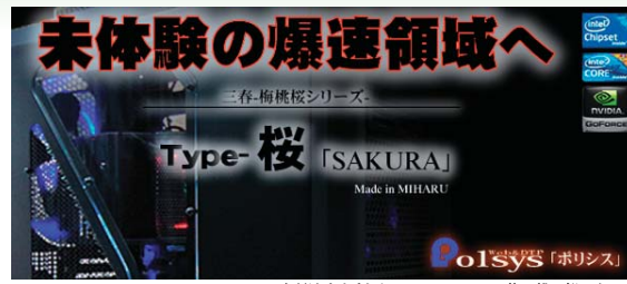
上記はオリジナルパソコン Miharu・梅・桜シリーズ