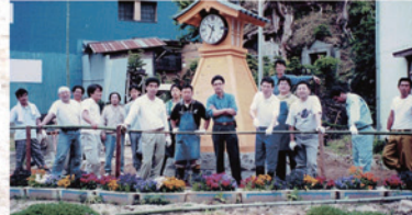
▲時計付櫓行灯の設置(平成8年)