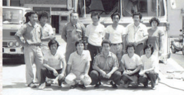
▲献血への協力(昭和60年頃)

昭和44年(1969年)に三春町商工会 青年部が誕生し、今年で50年を迎える事になりました。三春町の様々なお店、企業の担い手の集まりで、ひとつの目標に向かい創意工夫をし実行してきた様々な事は、今の若い青年部員にも引き継がれています。