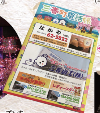
三春町の名所をスタンプポイントにした 「桜スタンプラリー」の開催(平成22年) ▲愛好者が多い三春町電話帳