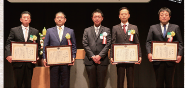
▲過去10年間の歴代青年部長に感謝状を贈呈