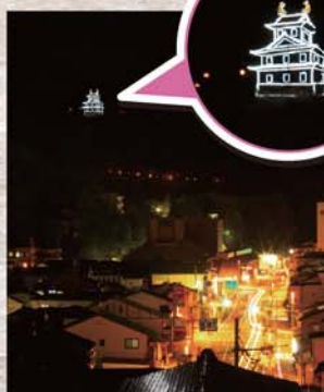
▲LED照明の一夜城 (平成30年8月1日～16日)