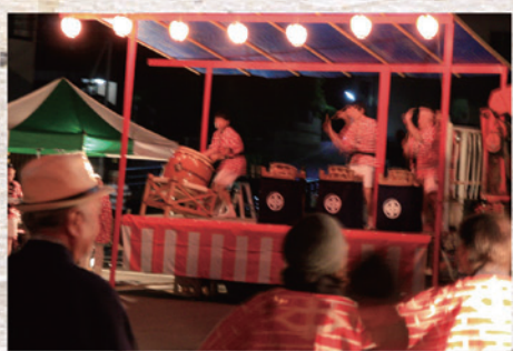
8月11日(日) 中町盆踊り 場所: 中町公民館前