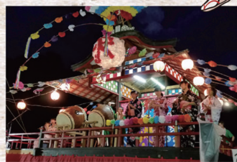
8月14日(水) 沢石豊年盆踊り 場所: 沢石運動場