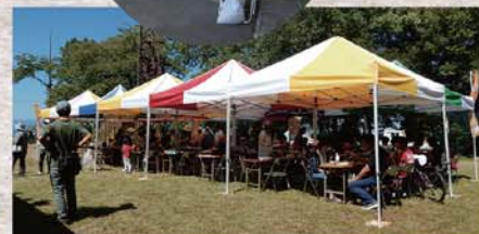
▲商店めぐりスタンプラリー お城山バーベキュー(平成30年9月23日)