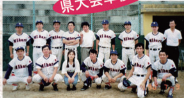
▲親善野球大会(平成2年)