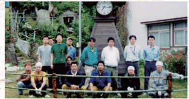
▲時計付櫓行灯清掃(平成15年)