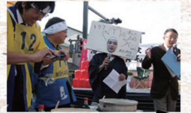
▲湯どうふ食べくらべ大会 (平成22年)