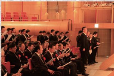
▲記念式典では三春町長をはじめ 多方面から多くの方が参加。

日時/平成31年3月3日(日) 15:00~16:00 会場/三春交流館「まほら」