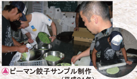
▲ピーマン餃子サンプル制作 (平成21年)