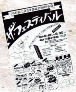
▲20周年記念事業 「ザ・フェスティバル」 (昭和63年)