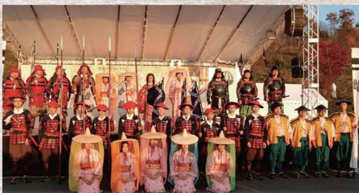
▲愛姫輿入れ行列 (平成30年11月11日 三春秋まつり会場内)

三春町商工業の活性化の為、商工会々員の皆様の思いに寄り添って、役員一同尽力してまいりますので、今後とも御支援・御協力下さいます様、宜しくお願い申し上げます。