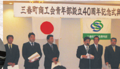
▲青年部40周年記念式典 (平成21年)