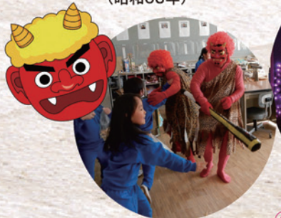
▲青年部の色となっている 「三春に鬼が来た」事業 (平成21年～)