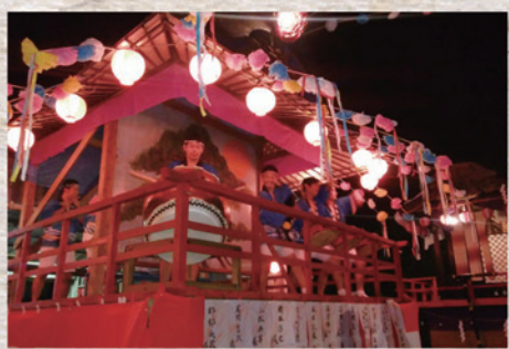
8月18日(日) 新町盆踊り 場所: 新町セリ場跡