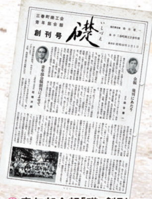
▲青年部会報「礎」創刊 (昭和60年3月)

昭和44年(1969年)に三春町商工会 青年部が誕生し、今年で50年を迎える事になりました。三春町の様々なお店、企業の担い手の集まりで、ひとつの目標に向かい創意工夫をし実行してきた様々な事は、今の若い青年部員にも引き継がれています。