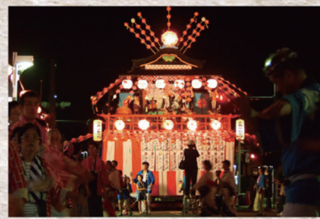
8月15日(木)・16日(金) 三春盆踊り 場所: 三春町大町(おまつり道路)