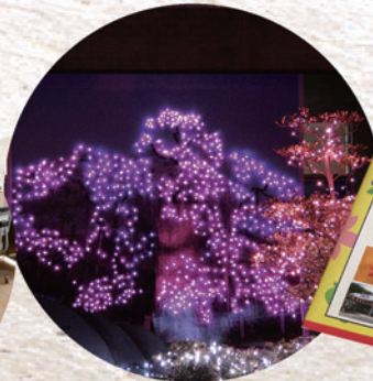
▲三春町のクリスマスシーズンを 華やかにしているイルミネーション 設置作業。(平成21年～)