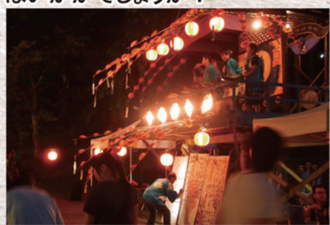
8月3日(土) 八幡町盆踊り 場所: 八幡神社境内(八幡町遊園地)

8月になると三春町の様々な場所で盆踊りが開催されています。代表的な三春盆踊り、独創的なバチさばきと二連大太鼓の沢石豊年盆踊り等、各地区で工夫を凝らした様々な盆踊りに足を運んでみてはいかがでしょうか？