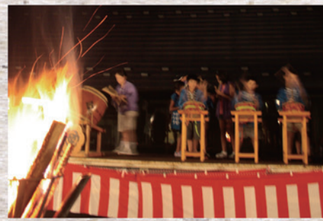
8月30日(金) 大町晦日盆踊り 場所: 三春交流館「まほら」駐車場