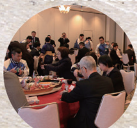
▲青年部オリジナルラベルの記念酒

日時/平成31年3月3日(日) 16:30~18:00 会場/みはる浪漫 割烹 八文字屋