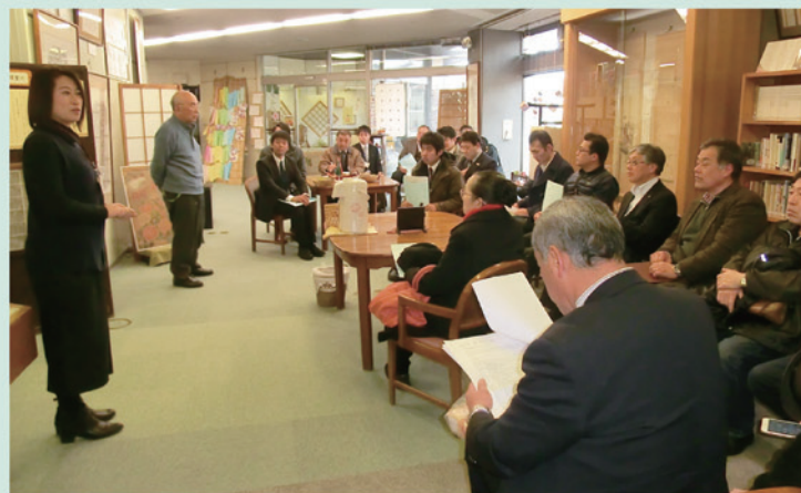
芭蕉記念館で説明に耳をかたむける部員一同