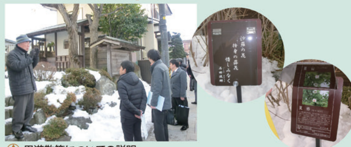
周遊散策についての説明