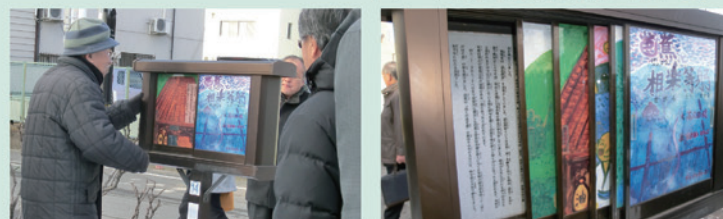
プレートをめくると意味合い表示