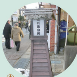
各所に設置された軒行燈