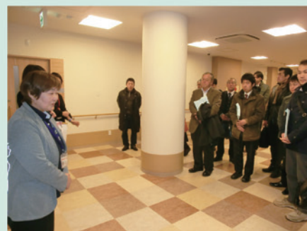
エルキューブの視察