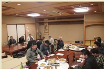
●場所を変え若松屋旅館での新年会