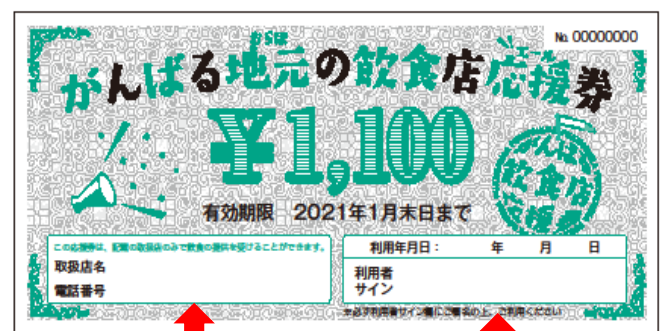
【法人事業者用利用券額面1,100円】